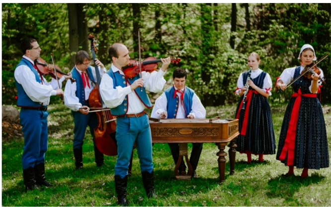
FS SLEZAN – Cimbálová muzika