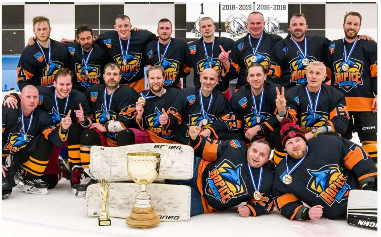
HC Ropice, mistři BAHL 2022/2023