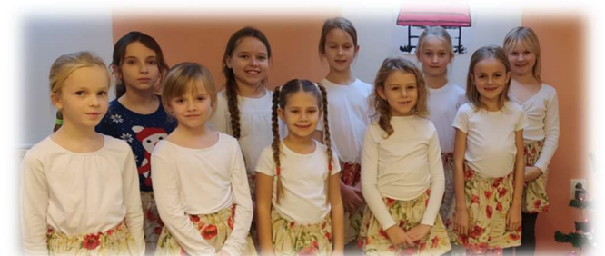
POLÍČKO – dětský pěvecký sbor

Pro rezervaci místa volejte 558 735 165.